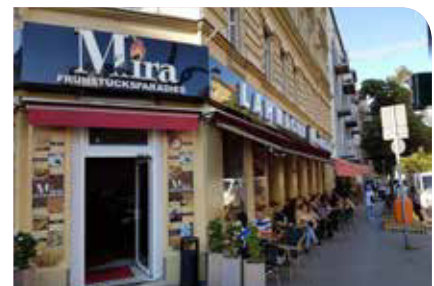
Gleich nebenan: Mira Breakfast

Eine Pause im Mira ist aber nicht nur zu typischen Restaurant-Öffnungszeiten möglich, sondern zu jeder Tages- und Nachtzeit, denn das Restaurant hat rund um die Uhr geöffnet. Da morgens nicht jedem Gast nach dem Duft deftiger Speisen vom Holzkohlegrill zumute ist, hat der Betreiber gleich nebenan ein Café eröffnet: Das ebenso gut besuchte Mira Breakfast, das online als „Frühstücksparadies“ bezeichnet wird, ist stilvoll gestaltet und bietet neben einer großen Frühstücksauswahl auch außergewöhnliche Leckereien an, so dass mancher Gast hier das Gefühl hat, sich in einem Ferienhotel in der Türkei zu befinden. Aufgrund der Beliebtheit des gastronomischen Duos in Neukölln eröffnet der Betreiber in etwa zeitgleich mit Erscheinen