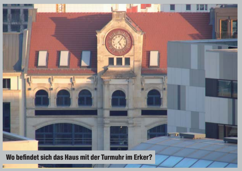
Wo befindet sich das Haus mit der Turmuhr im Erker?

Lösung Folge 12: 1 Heinz-Brandt-Straße; 2 Der Grotte ist im Teltowkanal aufgegangen; 3 Der Juliußsturm auf der Zitadelle in Haselhorst (erbaut ca. um 1200); 4 Max Liebermann anlässlich der Ernennung Hitlers zum Reichskanzler; 5 Lichtenfelde; 6 Bunsenstr. (A 100); 7 in Bernau (in der „Waldsiedlung Mitte an der Caroline-Michaels-Straße; 10 Marzahn; 11 Stresemannstraße; 12 Friedrich-Engels-Straße; 13 „Niemand hat die Absicht, eine Mauer zu errichten.“ (Walter Ulbricht; zwei Monate vor dem Mauerbau); 14 Hamburger Straße; 15 Rembrandtstraße; 16 BM für Bildung und Forschung, Hannoverische Str. 28-30; 17 Gesundbrunnen; 18 Attilastraße; 19 Altmstadtstraße; 20 Konrad-Wolf-Straße; 21 Mohrenstraße; 22 Wedding; 23 Lichtenfelde; 24 Otto-Münchenener Straße (Frohnau); 28 Bahnübergang am S-Bahnhof Lichtenrade; 27 Suhr-Allee; 25 Schweriner Ring; 26 Bayerische Straße und Bayerallee; 27 Friedrichsfelde; 28 Hauptstraße; 29 Rosenfelderpromenade; 30 Oraniendammbrücke über das Tegeler Fließ; 31 Hauptstraße (Rosenthal); 32 Hakenfelde; 33 Rahnsdorf. Die Bildungs- Am Hausvogteiplatz 12. Im Haus sitzt die Zentrale der TLG Immobilien GmbH.