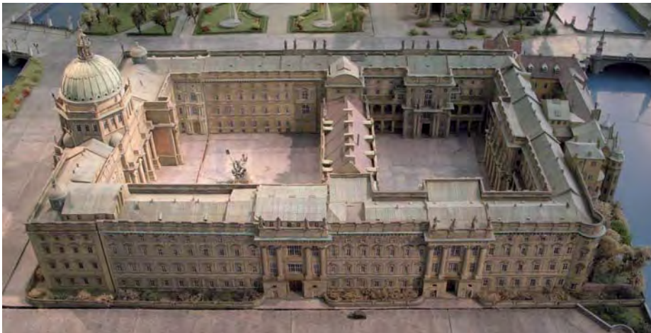
Modell des historischen Berliner Schlosses (von Süden aus gesehen)

Anhand von Film- und Fotodokumenten lässt sich jedoch – wie in einer Detektivgeschichte – genau nachvollziehen, dass Liebknecht erstens nicht auf dem Balkon, sondern auf einem Sanitätswagen vor dem Schloss stand, dass zweitens das falsche Portal im Staatsratsgebäude eingebaut wurde, und dass dieses drittens nur noch in wenigen Teilen original erhalten ist, da es bei der Schlosssprengung 1950, die das DDR-Regime unter Walter Ulbricht gegen massive Proteste der Bevölkerung angeordnet hatte, in viele Teile zerfiel. Weitere Informationen über das Stadtschloss erhält der Besucher anhand von Informationstafeln, Filmen und einzelnen bereits angefertigten Schmuckelementen der Schlossfassade.