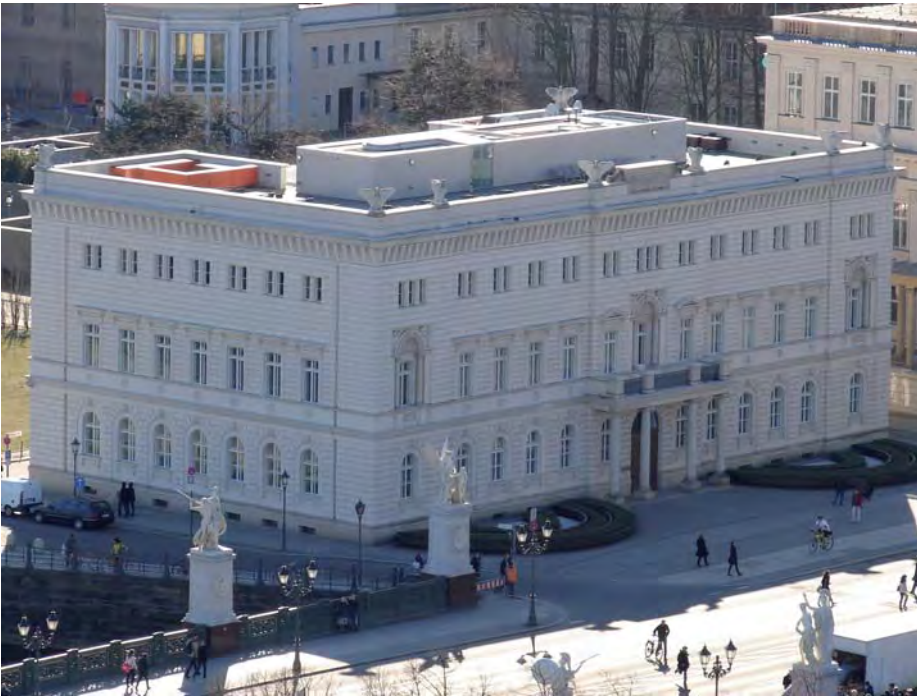
Kommandantenhaus , Unter den Linden 1 (Niederlagstraße ⇌ Schinkelplatz) Hinter der historisch wirkenden Fassade befindet sich ein modernes Veranstaltungsgebäude eines Medienkonzerns.

des baufällig gewordenen Wohnhauses wurde 1795-96 ein repräsentativer, königlicher Bau errichtet, der ab 1799 zum Sitz des Kommandanten der Berliner Garnison wurde und dies auch bis 1945 blieb.