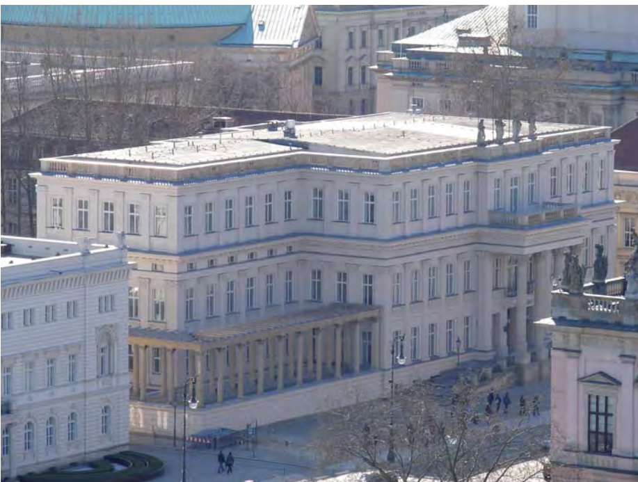
Kronprinzenpalais , Unter den Linden 3 (Oberwallstr. ⇌ Niederlagstr.) Im Gästehaus des Ost-Berliner Magistrats wurde am 31. August 1990 der Einigungsvertrag unterschrieben.

ner Garnisonen liefen die unter dem Decknamen „Walküre“ zusammengefassten Befehle, die nach dem Attentat auf Hitler zur Abriegelung und Besetzung der Machtzentralen führen sollten. Nach dem Scheitern des Attentats wurde er vom „Volkgerichtshof“ zum Tode verurteilt und am 8. August 1944 im Strafgängnis Plötzensee hingerichtet. Danach zog für kurze Zeit Heinrich Himmler, der zu dieser Zeit Oberbefehlshaber des Ersatzheeres und Chef der Heeresrüstung war, mit seiner Familie Unter den Linden 1 ein.