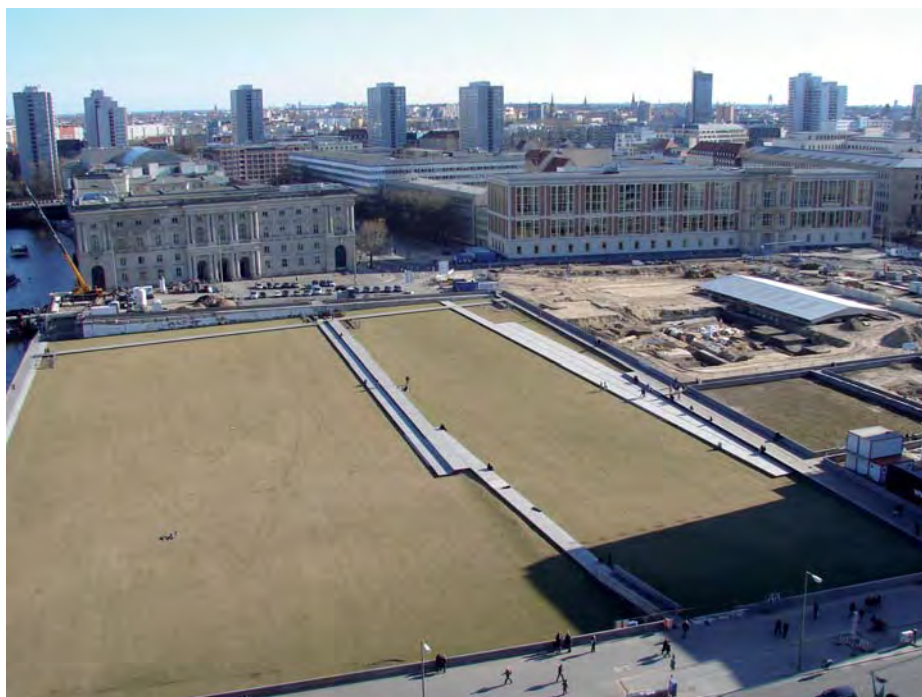
Aussicht vom Kuppelungang des Berliner Doms in südlicher Richtung auf Wiese und Ausgrabungsstätte am Schloßplatz, die als archäologische Fenster in den künftigen U-Bahnhof Berliner Rathaus (U5) und das Humboldtforum integriert werden – ein großer Teil der Freifläche wird 2019 vom „neuen“ Schloss eingenommen.

vorbei, welches Zeichnungen, Entwürfe und Modelle aus der Planungs- und Entstehungsgeschichte des Berliner Doms präsentiert. In der Ausstellung wird berichtet, dass der uns heute bekannte und von 1894 bis 1905 von Julius Raschdorff erbaute Dom bereits drei Vorgänger hatte. Erste Domkirche war von 1465 bis 1535 die im Stadtschloss untergebrachte Erasmus-Kapelle. In ihrer Funktion abgelöst wurde sie durch den Umbau der südlich vom Stadtschloss gelegenen Dominikanerkirche, die ab 1536 bis zu ihrem Abriss wegen Baufälligkeit 1747 als Domkirche diente. Die nach dem Abriss frei gewordene Fläche wurde zum Schloßplatz. Den nachfolgenden Bau ließ Friedrich der Große am heutigen Ort Am Lustgarten errichten. Der barocke Bau wurde 1822 von Karl Friedrich Schinkel klassizistisch umgestaltet und 1893