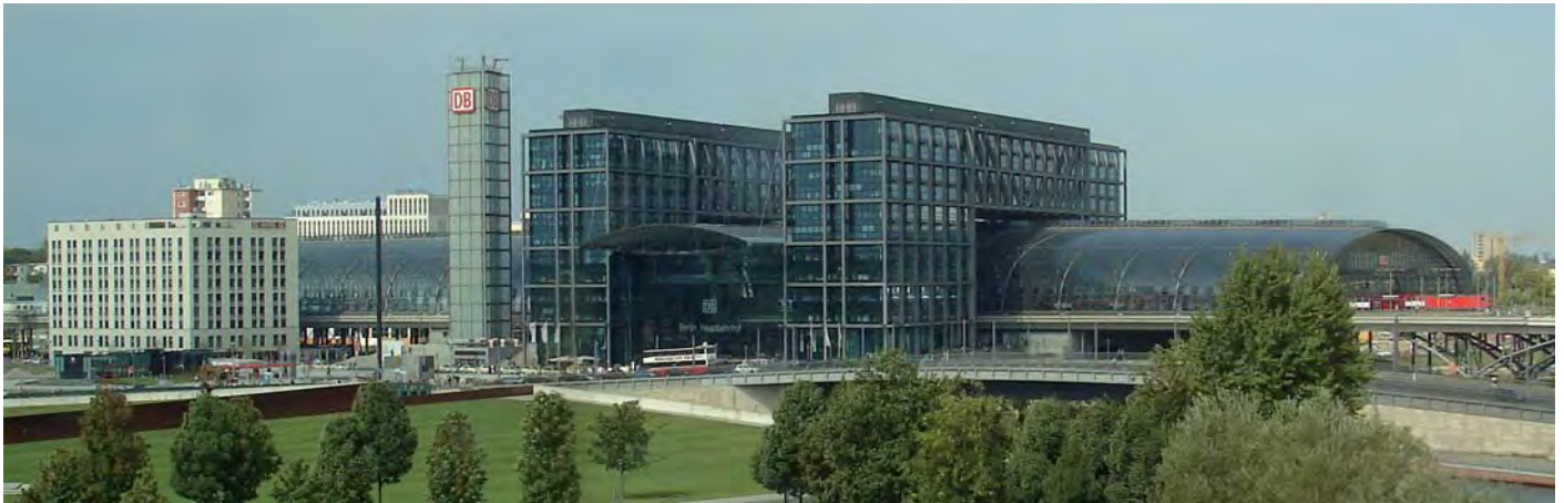
Das Meininger Hotel Berlin Hauptbahnhof (am linken Bildrand) steht etwa 120 Meter westlich vom Südeingang des Hauptbahnhofs.

Ein weiteres konfessionelles Gebäude, das neben den genannten über eine täglich (außer samstags) geöffnete Aussichtsplattform verfügt, ist die Neue Synagoge in der Oranienburger Straße 28-30 in Mitte. Die Aussicht von der Plattform unterhalb der Kuppel hat jedoch so wenig zu bieten, dass deren Besuch sich nur lohnt, wenn man vor Ort die ständige Ausstellung oder eine Sonderausstellung besucht und seinen Besuch mit dem Ausblick abrunden möchte. Dass das Fotografieren der Aussicht aus Sicherheitsgründen verboten ist, stört nicht weiter, da man lediglich in südlicher und östlicher Richtung hier und da Kirchtürme und andere hohe Bauwerke aus der Stadtsilhouette herausragen sieht. Die Einschränkungen resultieren zum einen aus der geringen Plattformhöhe von 23 Metern und zum anderen aus der dichten Bebauung der einstigen Spandauer Vorstadt und des östlich angrenzenden Scheunenviertels.