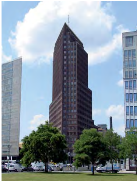
„Kollhoff-Tower“ vom Leipziger Platz aus gesehen

Der im Architekturstil der USA der 1920er Jahre errichtete „Kollhoff-Tower“ bietet aber wie der Berliner Dom aufgrund seiner zentralen Lage eine sehr gute Sicht auf das Stadtzentrum aus der Nähe. Seine Aussichtsplattform liegt mit 100 Metern jedoch doppelt so hoch, was weniger Details der Umgebung erkennen lässt, dafür aber eine größere Sichtweite bietet und beispielsweise einen Blick auf das Kulturforum gestattet, wie er auf dem großen Bild am Anfang dieser Folge zu sehen ist.