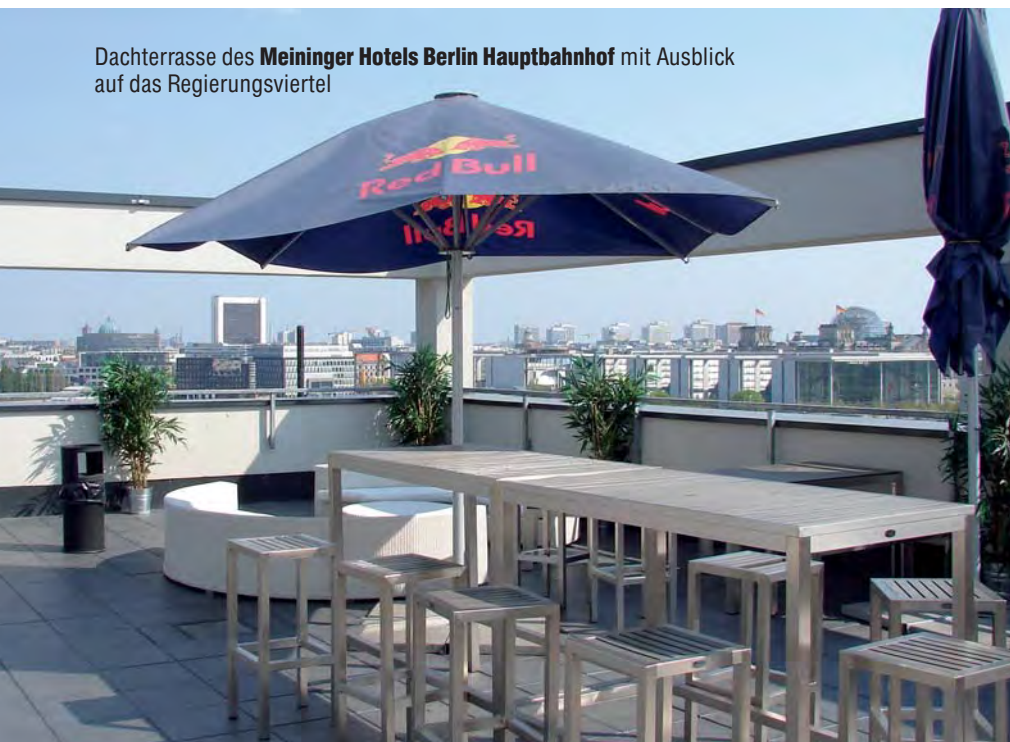
Dachterrasse des Meininger Hotels Berlin Hauptbahnhof mit Ausblick auf das Regierungsviertel

Eine intensive Nutzung der windigen und somit tendenziell kühlen Dachterrasse findet nur im Hochsommer statt. Meist im Juli und August wird auf dem Dach die „Cloud Nine Bar“ geöffnet. Dennoch ist die Terrasse 365 Tage im Jahr rund um die Uhr geöffnet, da das Hotel seinen Gästen das ganze Jahr über die schöne Aussicht bieten möchte. Lediglich während Staatsbesuchen wird die Aussichtsplattform für jeweils wenige Stunden geschlossen. Da Besucher des Hotels grundsätzlich willkommen sind, um entweder an der Bar im Erdgeschoss oder im Sommer auf der Dachterrasse etwas zu trinken, ist ihnen ebenso ein kostenfreier Besuch der Dachterrasse jederzeit möglich.