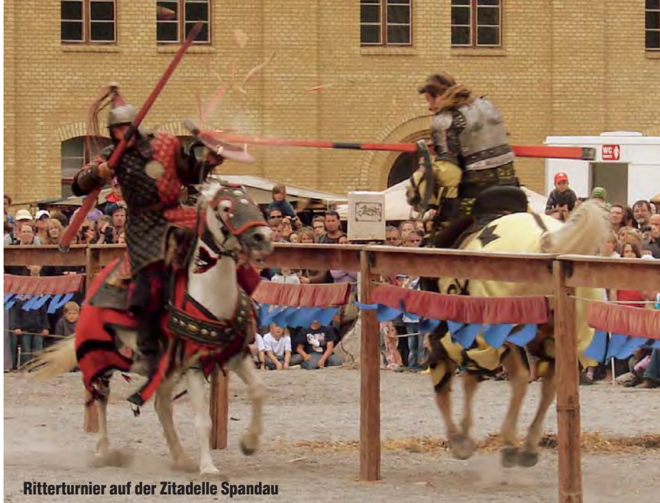
Ritterturnier auf der Zitadelle Spandau

Die Anlage ist heute ein kulturhistorisches Zentrum: Das Kommandantenhaus beherbergt eine Ausstellung über die Geschichte der Zitadelle, im Palas finden Konzerte und Theateraufführungen statt, und auch das Regionalmuseum Spandau hat auf dem Gelände seine Heimat gefunden. Führungen geleiten Besucher an Wochenenden durch sonst unzugängliche Bereiche wie Kasematten, Gewölberäume und das Pulvermagazin. Auf der Freilichtbühne finden in der warmen Jahreszeit Konzerte statt – was immer wieder zu Konflikten mit Anwohnern führt.