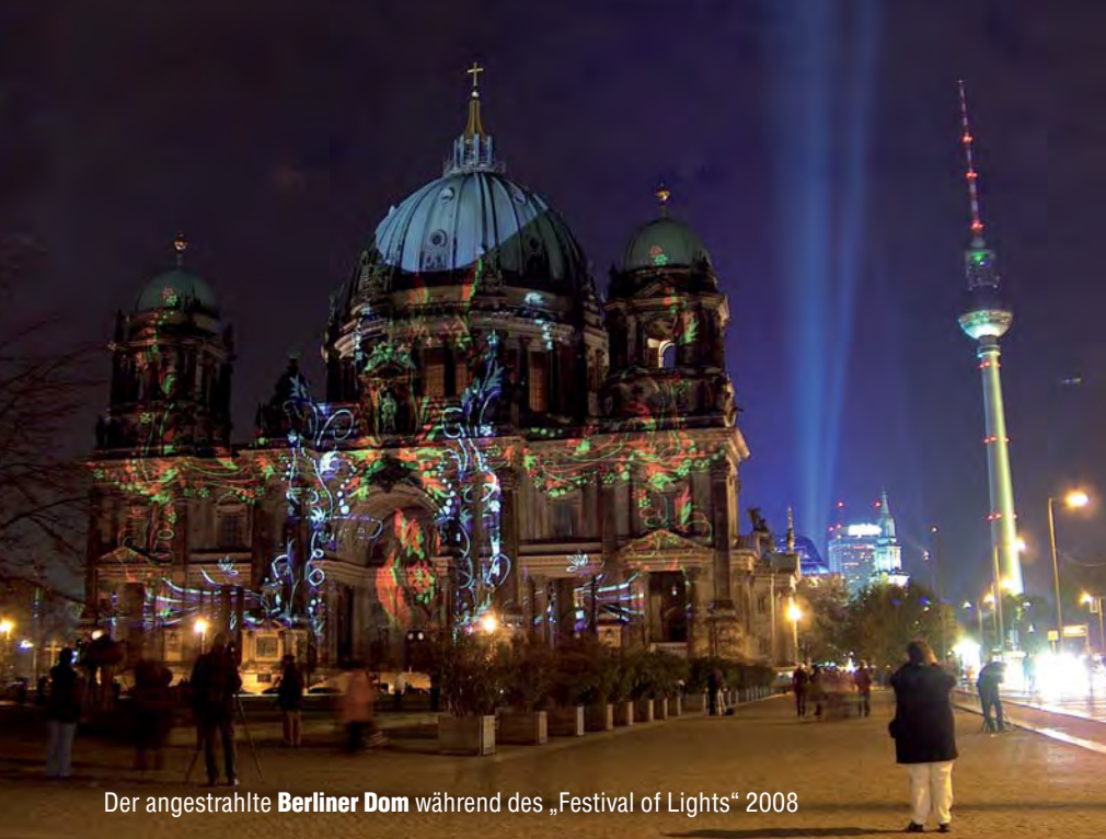
Der angestrahlte Berliner Dom während des „Festival of Lights“ 2008

Das Treppenhaus liegt im Südflügel, der durch den Innenraum des Doms erreichbar ist. Seine Pracht kann der Besucher beim Lauschen von Proben zu Konzerten und Chorgesängen bewundern, die regelmäßig stattfinden. Hier befindet sich zudem die Sauer-Orgel, die über 7.269 Pfeifen und 113 Register verfügt und bei ihrer Einweihung 1905 als die größte in Deutschland galt. Sie ist täglich in zwei Andachten zu hören, sonntags in den Gottesdiensten sowie häufig in Konzerten. In Orgelführungen werden dem Publikum am Arbeitsplatz des Organisten Details gezeigt, von denen auch Besucher beeindruckt sind, die sich sonst wenig für Orgelmusik interessieren.