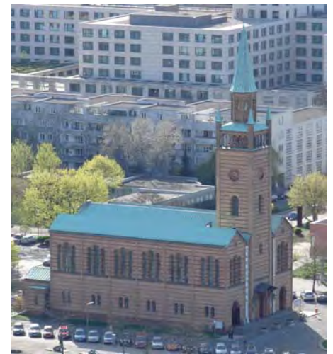
Sankt Matthäus-Kirche – als Aussichtsplattform ein Geheimtipp

Blickt man vom „Kollhoff-Tower“ etwa 500 Meter in westlicher Richtung, dann erkennt man dort inmitten des Kulturforums die Sankt Matthäus-Kirche . Neben dem Berliner und dem Französischen Dom gehört sie zu den einzigen drei Kirchen in Berlin, die nahezu täglich und ganzjährig dem Besucher die Möglichkeit bieten, vom Kirchturm bzw. der Domkuppel die Aussicht über Berlin zu genießen.