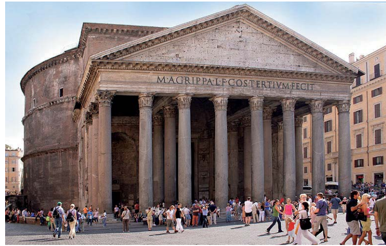
Pantheon in Rom: Das ca. 1890 Jahre alte Pantheon (auf deutsch etwa allen Göttern) war bauliches Vorbild für die heutige St. Hedwigs-Kathedrale (und für zahlreiche weitere europäische Gebäude).

das er von der Kirche verfolgt und schließlich als „vogelfrei“ erklärt wurde – eine Erlaubnis zum straffreien Mord an Luther durch jedermann, zur damaligen unaufgeklärten Zeit keine Seltenheit. Als Junker getarnt auf der Wartburg erarbeitete Luther die Grundlagen für ein evangelisches Gemeindeleben. Das Resultat seines Engagements zum Reformieren der Kirche war damals weniger eine Modernisierung der römisch-katholischen Kirche als viel mehr – bis Mitte des 17. Jahrhunderts, hundert Jahre nach Luthers natürlichem Tod – die Abspaltung von kirchlichen Strömungen, die sich auf Dauer nicht unterdrücken ließen und nach langem Ringen eine Gleichberechtigung gegenüber der römisch-katholischen Kirche erlangten. Aus dem Protest gegen die römisch-katholische Kirche war die protestantische Kirche erwachsen, die sich selbst als evangelisch bezeichnet.