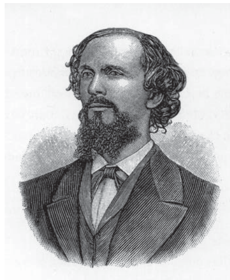
Karl Heinrich Ulrichs: Nach dem mutigen Allround-Wissenschaftler soll die jetzige Einemstraße benannt werden.

Nicht nur die im Norden Schönebergs verbreitete und aktive Schwulen- und Lesbenzene hat allen Grund, sich an dem Straßennamen zu stören, war von Einem doch ein erklärter Befürworter des Mordes an Homosexuellen. Auf Anregung einer schwulen Initiative beschloss die BVV vor gut einem Jahr, die Einemstraße umzubenennen in Karl-Heinrich-Ulrichs-Straße. Ulrichs war Jurist, Journalist, Verleger und Pionier der Sexualwissenschaft und wurde 28 Jahre früher geboren als von Einem. Noch bevor das Wort „homosexuell“ geprägt wurde, stellte er als einer der ersten Prominenten die damals annähernd selbstverständliche und auch heute noch weit verbreitete Ansicht in Frage, gleichgeschlechtliche Liebe sei verwerflich – als ob man für seine geschlechtliche Ausrichtung etwas könnte. Auf dem Deutschen Juristentag 1867 in München forderte er vor 500 Zuhörern selbstbewusst die Straffreiheit homosexueller Handlungen und die Möglichkeit der „mannmännlichen Ehe“. Seine