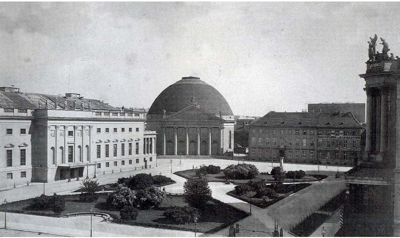
Opernplatz um 1850: Der heutige Bebelplatz. In der Mitte die St. Hedwigs-Kirche von 1773 mit der später gebauten Kuppel, links die Lindenoper, am rechten Rand das Alte Palais.