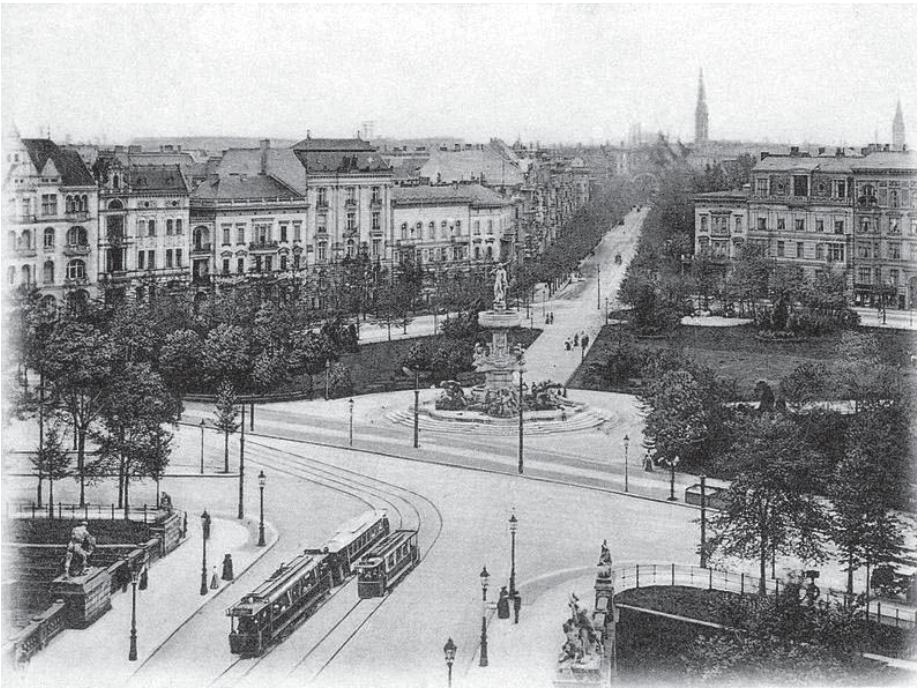
Lützowplatz um 1905: Blick vom Vorgänger der heutigen Herkulesbrücke über den Platz in die heutige Einemstraße in Richtung Nollendorfpfatz

umbenannt, einem aus dem Königreich Hannover stammenden preußischen Offizier, in dessen Biografie zwei der häufigsten Silben „Kriegs-“ und „Schlacht“ lauten.